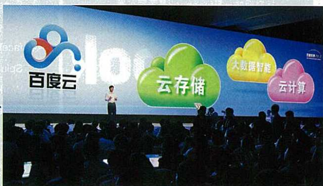
百度與騰訊、阿里巴巴內地三大網絡巨頭，獲國家支持，在行內取得壟斷地位，不容易被其他公司取代。

回首二千年的科網熱潮，莫乃光說香港股民「上車遲、跳車快」。「環球科網熱潮其實早在九五、九六年開始，美國燒得好盛，香港九八、九九年重建華搞數碼港，李澤楷收購香港電訊才開始興起；二千年科網股爆發，香港人卻第一個跳車！」