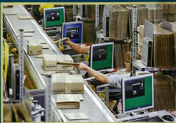
亞馬遜從初期主要做網上書店，發展成龐大的網購物流公司，股價有實質的業績支持。