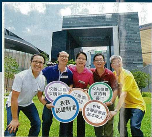
莫乃光（左三）○五年開始全身投入公職，一二年當選資訊科技界立法會議員。